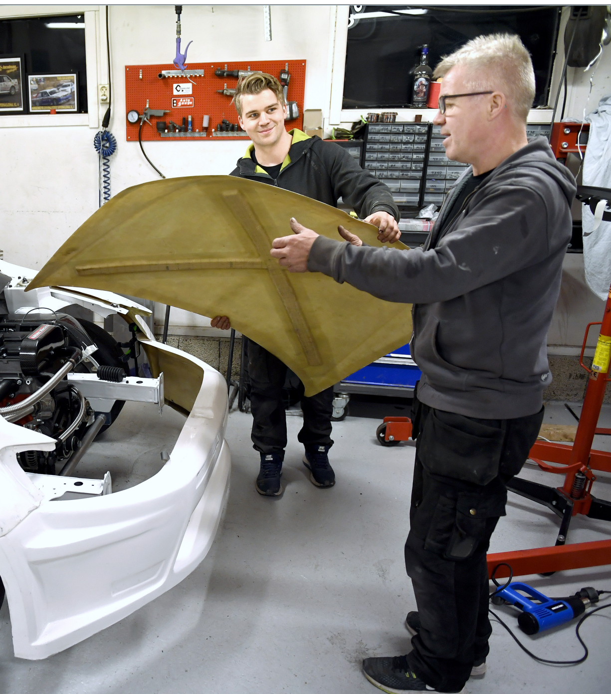
dig stund på arbeid med den nye bilen til sommerens storsatsing i rallycross. Alt bygges fra bunn med de beste ste finpuss og oppstart. Fra 1. april skal den være klar til testing.